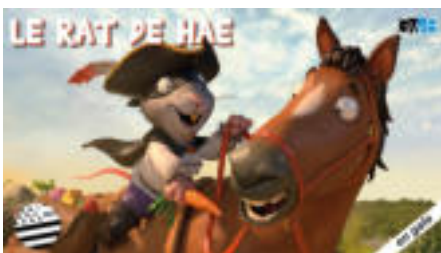
LE RAT DE HAE 25 min