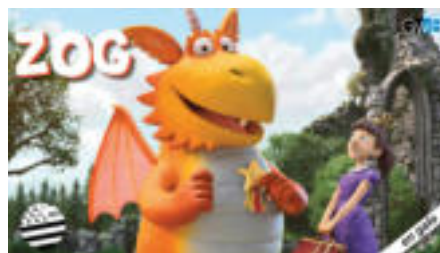
ZOG LE SERPIDÂ 27 min