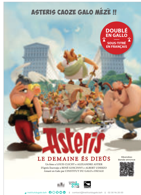
ASTERIS E LE DEMAIN ÉS DIEÛS Fime doublè en gallo 1h26