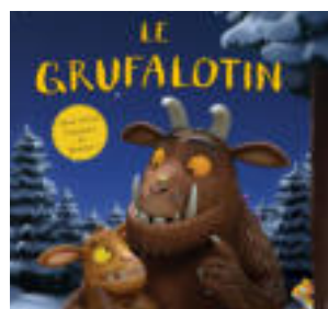
LE GRUFALOTIN 27 min