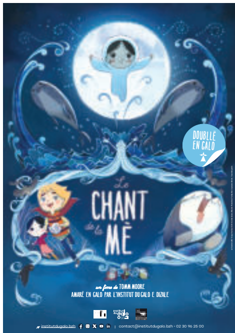
LE CHANT DE LA MÈ Fime doublè en gallo 1h33

Contactez-nous à l'adresse suivante : contact@institutdugalo.bzh ou au 02 30 96 25 00