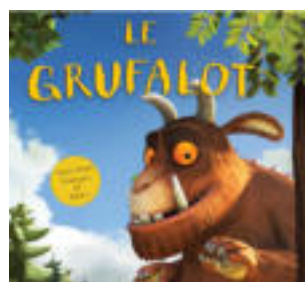
LE GRUFALOT 27 min