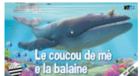
LA BALAINE E LE COUCOU DE MÈ 42 min